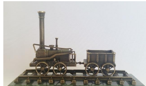
Модель паровоза Черепановых

Первой железной дорогой в России считается дорога из Санкт-Петербурга в Царское село, открытая в 1837 году. Для неё купили английский паровоз, хотя за три года до этого уральские изобретатели Ефим и Мирон Черепановы построили свой, русский, паровик не хуже английского. Он возил руду с медного рудника на завод в Нижнем Тагиле. Но об этом изобретении ничего не знали в Петербурге!